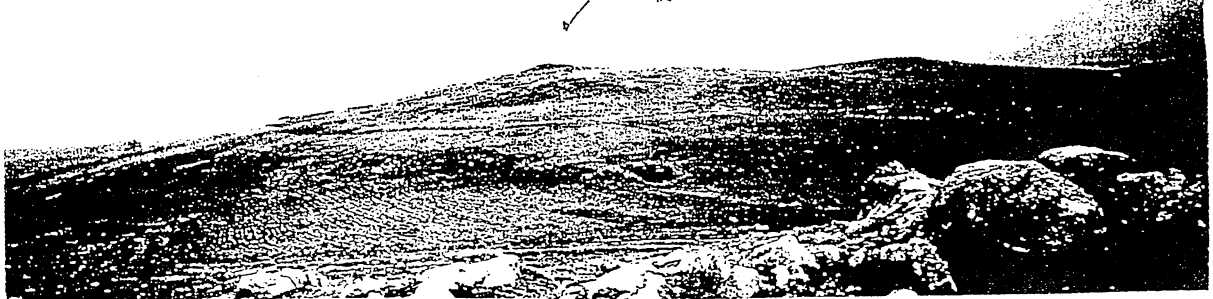
ここが最も高い部分