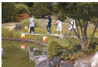
タイムコントロール