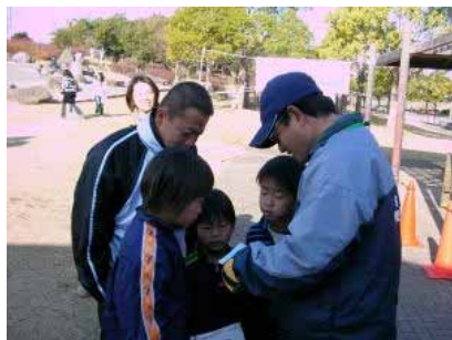
[ 初心者への説明の様子 ]

新庄総合公園は、子ども連れで訪れるのには良い場所です。広場でも遊べますし、遊具も色々なものがあって、中学生ぐらいでも飽きないぐらいです。うちの生徒は、芝生広場で走り回っていました。