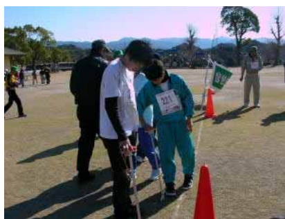
[ アクティブート中 ]

広場に戻っていくときに時間も残り少なくなったので、広場回りのコントロールを拾っていき、フィニッシュに。残り数秒というところで、なんとか減点なしで帰還できました。