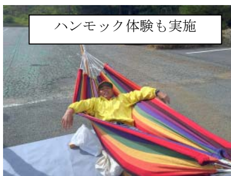
ハンモック体験も実施