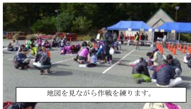
地図を見ながら作戦を練ります。