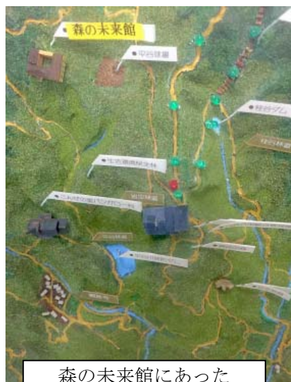
森の未来館にあった トレインの模型

やはり山を使うオリエンテリングとなると、大変なのが地主との交渉。パークOとは違い地権者が複雑に入り組んでいて、個別の交渉はほぼ不可能。今回はあるオリエンティアが金勝(こんぜ)森林組合とパイプがあったためなんとかトレインを確保することができ非常に感謝しています。今後も、有料でのトレイン使用について交渉しているところです。