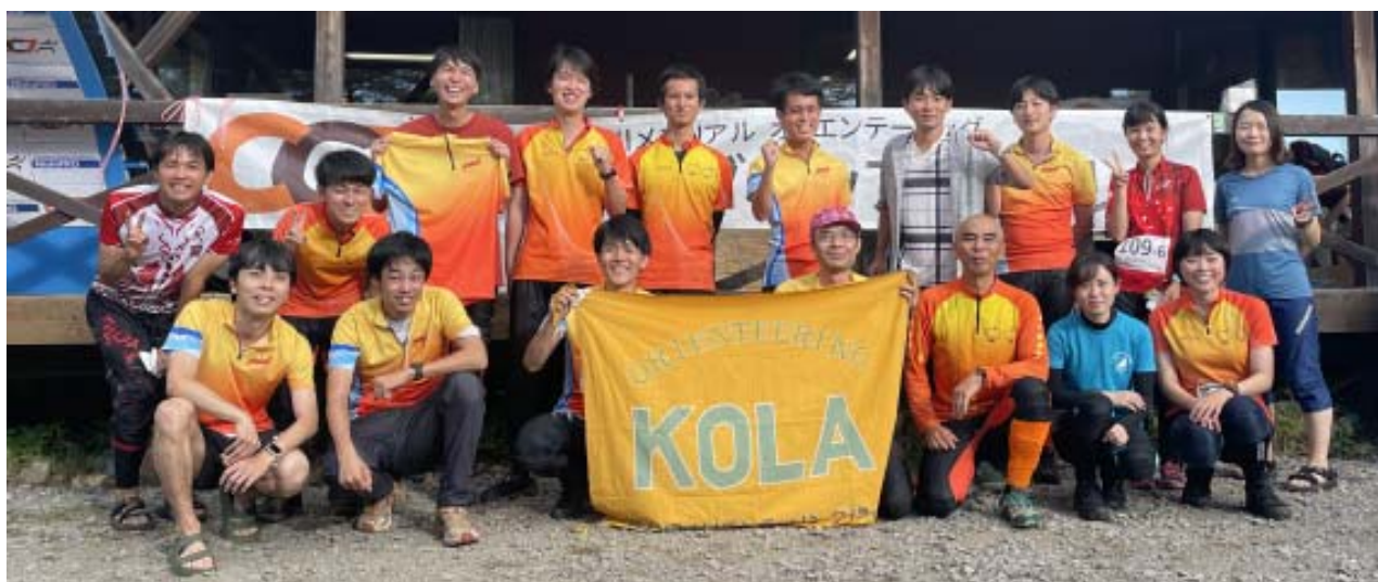
今回 CC7 に参加した KOLA メンバー 17名です。