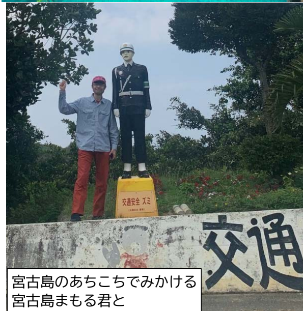
宮古島のあちこちでみかける宮古島まもる君と