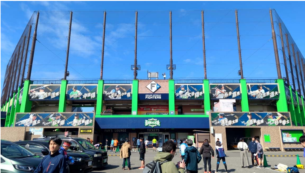
▲映っている選手が軒並み日ハムで引退していない・・・。

まず、2月17日ですが、千葉県鎌ケ谷市で開かれた「ファイターズ鎌ケ谷スタジアムスプリント」に参加しました。