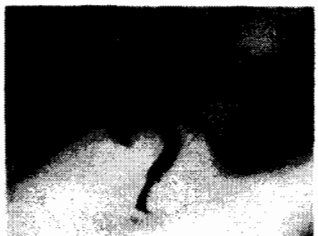
横浜に戻ってきたら、自宅前にいたカブトムシ

9時(30.8度)、10時(32.1度)、11時(33.0度)、12時(33.7度)、13時(34.1)、14時(35.1度)、15時(34.6度)