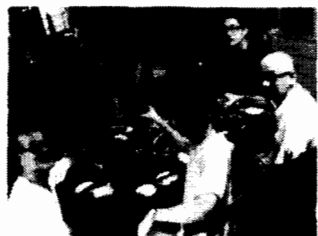
今年のスタッフ一同