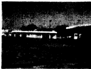
エキスポランド閉園中