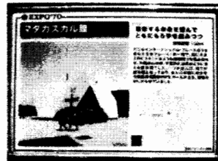
マダガスカル、はどこ？