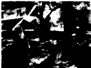
コン兵衛氏、皆さんがどんなスタートをするか見に来る