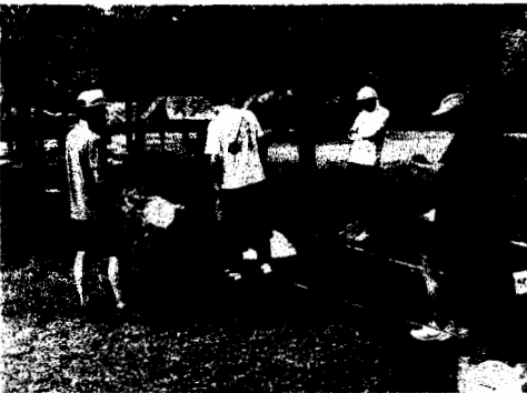
本日のスタッフ一同